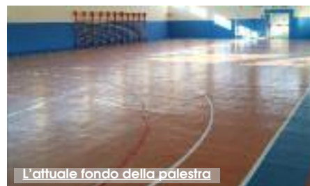
L'attuale fondo della palestra

Il Comune di Erice ha formalizzato la proposta di partecipazione al Bando "Sport e Periferie" per l'annualità 2018 per il finanziamento di lavori di adeguamento della palestra comunale "San Giuliano". L'impianto è stato riaperto lo scorso 28 novembre 2018 con gli alunni del Plesso Baden Powell dell'I.C. G. Mazzini di Erice che si sono riappropriati della propria palestra, chiusa un anno fa, per lavori di manutenzione straordinaria. Il nuovo progetto prevede la sostituzione dell'attuale pavimentazione con il parquet, la realizzazione di un controsoffitto fonoassorbente con nuovo impianto di illuminazione, il rifacimento degli spogliatoi e dei bagni per un importo complessivo di circa 496.000 euro, con una quota di compartecipazione a carico del comune di quasi 130.000 euro. «Continuiamo a lavorare incessantemente per